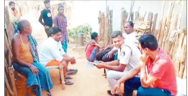
कार्यवाही के दौरान उपस्थित पुलिस व विभागीय अधिकारी।

वैवाहिक कार्यक्रमों का मौसम आते ही ग्रामीण अंचलों में विवाह शुरू होने लगे हैं। इस दौरान नाबालिगों के विवाह भी करा दिए जाते हैं, जिसे लेकर जिला प्रशासन पहले से ही अलर्ट रहता है।