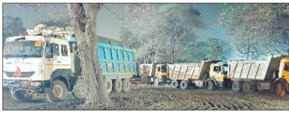
जप्त किए गए वाहन।

रेत व गिट्टी का अवैध रूप से परिवहन करने वाले तस्करो के खिलाफ खनिज विभाग की टीम एक्शन में आ गई है और लगातार इनके खिलाफ ताबड़तोड़ कार्रवाई कर रही है।