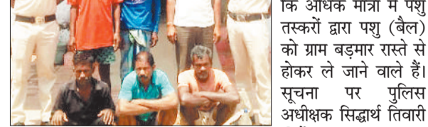
पकड़े गए आरोपी।