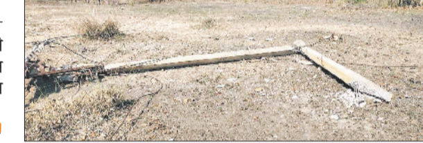
टोकर से टूटा विद्युत खंभा।

एक तेज रफ्तार ट्रेलर के चालक ने तेजी एवं लापरवाहीपूर्वक वाहन चलाते हुए 11 केवी की लगभग