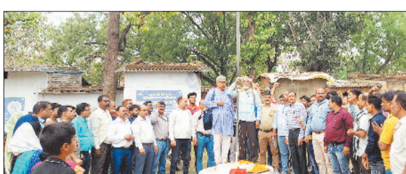
सम्मेलन में उपस्थित श्रमिक संघ के सदस्य।

राष्ट्रीय ट्रेड यूनियन ऑल इंडिया ट्रेड यूनियन कांग्रेस (एटक) से संबद्ध है एल्युमिनियम एम्पलाइज यूनियन का 50वां वार्षिक सम्मेलन एटक कार्यालय बालको में संपन्न हुआ।