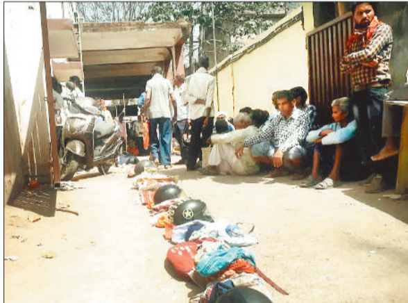
बैंक में अपनी बारी का इंतजार करते किसान।

जिला सहकारी बैंक को उनकी डिमांड के अनुसार चेस्ट बैंक से धन राशि नहीं मिलने के कारण बैंक की सभी 6 ब्रांच से 50 हजार से अधिक की राशि किसानों को नहीं मिल रही